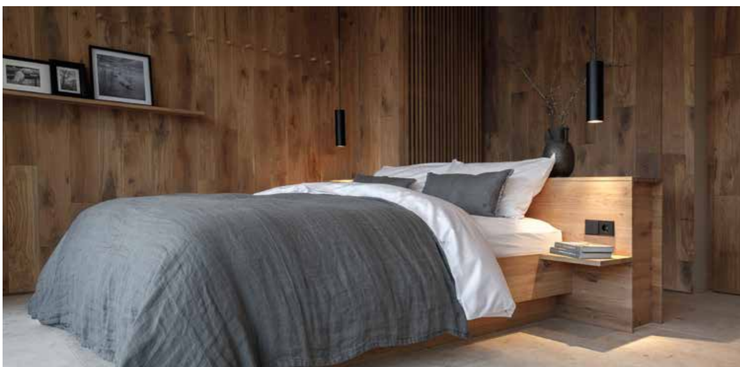
Uriges Eichenholz, kuschelige Doppelbetten, große Panoramafenster samt herrlichen Naturausblicken und heimelige Balkone – Wohlfühl-Design vereint zum luxuriösen Scheunen-Style im Naturhotel.